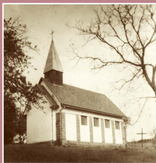
Na místě vypálené osady vybudovali v roce 1947 lidé z okolních vsí kapli