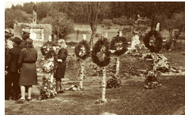
Při prvním smutečním aktu byly vystaveny symbolické kříže obětem z Ploštiny