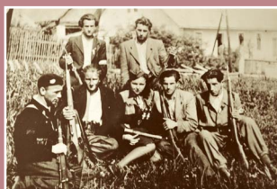
Partyzáni z prlovské skupiny v Jasenné (Pamětní síň Prlov)