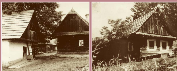
Dům čp. 23 a seník (vlevo), kde v ohni nalezlo smrt několik ploštinských mužů