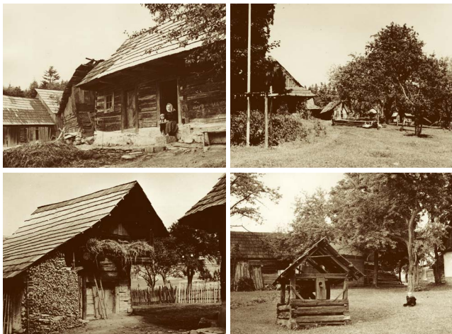
Roubené chalupy na Ploštíně zachytil při svém terénním výzkumu v roce 1944 prof. Chotek z Etnologického ústavu České akademie věd a umění (EÚ AV ČR)

Po potlačení Slovenského národního povstání na podzim 1944 začal s ostrými protipartyzánskými akcemi také nacistický aparát v Protektorátu Čechy a Morava. Geografické podmínky východní Moravy umožňovaly aktivní odpor vůči okupantům, proto sem byly směřovány paravýsadky vycvičených partyzánů ze Sovětského svazu. Bez dobrovolné ale i vynucené pomoci místních pasekářů by skupiny záškodníků vůbec nemohly existovat. Kolem Ploštiny a Prlova se soustředily jednotky 1. československé partyzánské brigády Jana Žižky, později pod vedením majora Dajana Bajanoviče Murzina, které se do oblasti Beskyd a Vizovických vrchů přesunuly v listopadu 1944. Počet partyzánů rozptýlených v oblasti východní Moravy byl odhadován až na 1300 mužů.