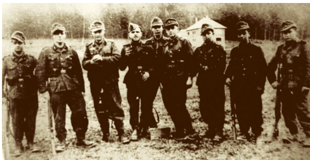
Členové protipartyzánské nacistické jednotky Josef v době výcviku na Slovensku v roce 1944